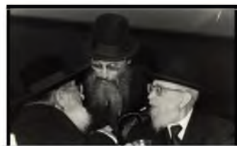
רבינו שליט"א עם להב"ח הגר"י הוטנר זצ"ל כ"כנסיה הגדולה' תש"מ

רבינו שליט"א סירב בפסקנות, ואמר: "אכן, יש מן הצדק בטענתו של מעכ"ת שליט"א, כשאבי עמד בראשות ישיבת רשב"י אשר במירון היתה הצדקה לשם הזה, שכן למדו בישיבה קבלה מתורתו של רשב"י. ועל אף שכיום אין לומדים בישיבה את תורת הקבלה, בכל זאת ישאר שמה 'ישיבת רשב"י' כפי שקראה אבי, וכך למדנו מיצחק אבינו כדברי הפסוק - 'ויקרא להם שמות בשמות אשר קרא אביו'."