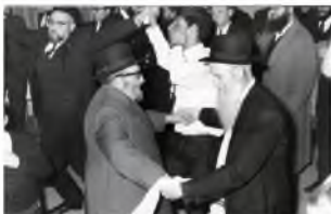
רַבֵּי זַאֵב רֹקֵד בְּמִרְץ בַּשְּׁמַחָת חַתָּן וְכֵלָה

כִּשְׁהִשְׁלִיחַ הַגִּיעַ, הַבִּין רַבֵּינוּ שֶׁהַמְשַׁלַּח נִמְצָא בְּאִזּוֹר, וְתִכְף שָׁאַל אוֹתוֹ "אֵיפֹה הָרַב אֵיִדֶלְמָן?" וְכַשְׁמָר לוֹ שְׁנַמְצָא לְמַטָּה, מִיָּהַר לְרַדַּת אֵלָיו וְלִכְבְּדוֹ, וְהַתְּכַוֵּף אֵל חֲלוֹן הַמַּכּוֹנֵינִי שֶׁר' זַאֵב יִשַׁב בָּהּ, וְכַשֵּׁר' זַאֵב רָצָה לְצַאֵת אֵלָיו - לֹא נָתַן לוֹ. וְשׁוּחָחוֹ אֲרוּכוֹת חַבִּיבּוֹת וּנְפַרְדּוֹ חַמִּימוֹת רַבָּה. (עַל פִּי 'ר' וּוְעֵלְעַל דְּעַר אֵיִדֶל מֶאָן עֵמּוּד 317)