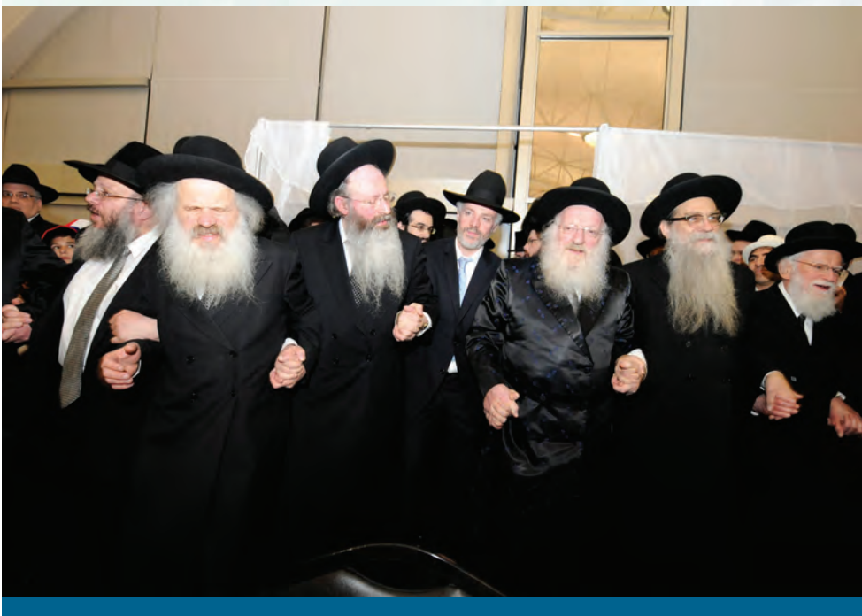
Dancing with the Roshei Yeshiva at the Purim mesibah in Bais Medrash Govoha.

When the Mashgiach was in Gateshead, he was the baal tefillah for Mussaf on Yamim Noraim. One year, there had been a