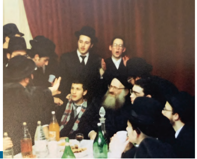
With talmidim in Gateshead on Purim