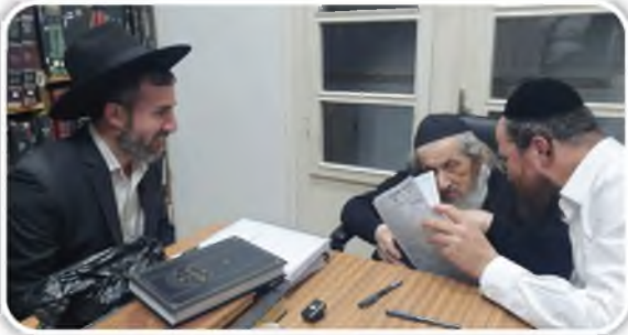
לקראת סיומה של השנה הראשונה להוצאת הגליון נכנסנו לרבנו והגשנו בפניו את הגליון, רבנו נהנה מהדברים בגליון, לקראת סיום בקשנו את ברכתו להמשיך הוצאת והפצת דברי התורה בקובץ גליונות וזכינו לקבל את ברכתו להמשיך בדרך

במלאות שנה להוצאת הגליון 'ודבר דבר' נודה לבורא עולמים על שזכינו לתת פתח לאוצרותיו העצומים של מרן רבינו שליט"א. והנה היא ידוע לכל שתורתו של רבינו עמוקה מיני ים, בעשרות ספריו על הש"ס ובעוד הענינים, כתובים בעומק גדול וברמיה, ולאו כל מוחא סביל דא. ועל כן אזרנו הלצנו לקרב את הדברים יותר לרוחו של כל אחד ואחד. ובפרט לפתוח צוהר לעולמו של רבינו שליט"א, מאשר הנחיל לנו מרבותיו - רבותינו מצוקי ארץ זי"א, ואת ניחוח דבריו בהגדרתו על כל גדול וגדול בשפה יחודית ונדירה, להגדירו ולתארו במתק שפתים. הזכינו להאיר לדור מהנהגותיו בין אדם למקום, ובין אדם לחבירו. ומידי שבוע בשבוע ומידי מועד במועדו הבאנו בס"ד מעט מתורתו והנהגתו. ועל כל זאת נודה לה על שהגענו עד הלום במלאות שנה שלימה שזכה זכינו להקיף את כל מועדי השנה ורוב פרשות השבוע.